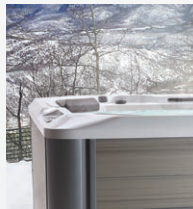
FiberCor® Hoge dichtheid Isolatie