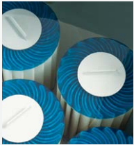
Filtration à 100 % Circulation SilentFlo