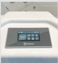
Panneau de commande tactile LCD couleur