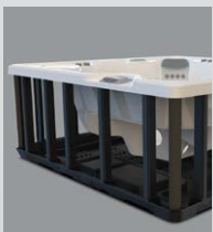
Base et structure en polymère