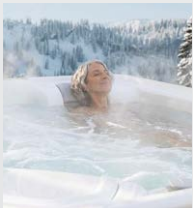
Efficacité énergétique supérieure