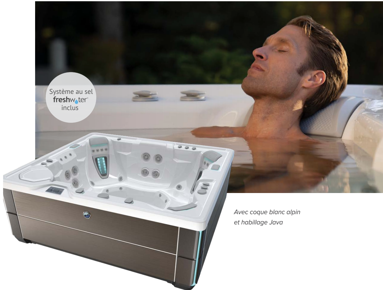
Avec coque blanc alpin et habillage Java

Personnes Places Jets Tension 7 places Sans lounge 49 Jets 230 V