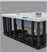
Base et structure en polymère