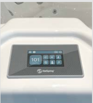
Panneau de commande tactile LCD couleur