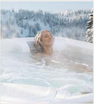
Efficacité énergétique supérieure