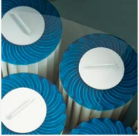
Filtration à 100 % Circulation SilentFlo