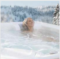
Efficacité énergétique supérieure