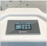
Panneau de commande tactile LCD couleur