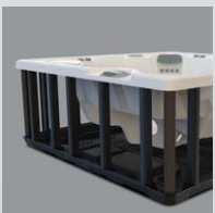
Base et structure en polymère