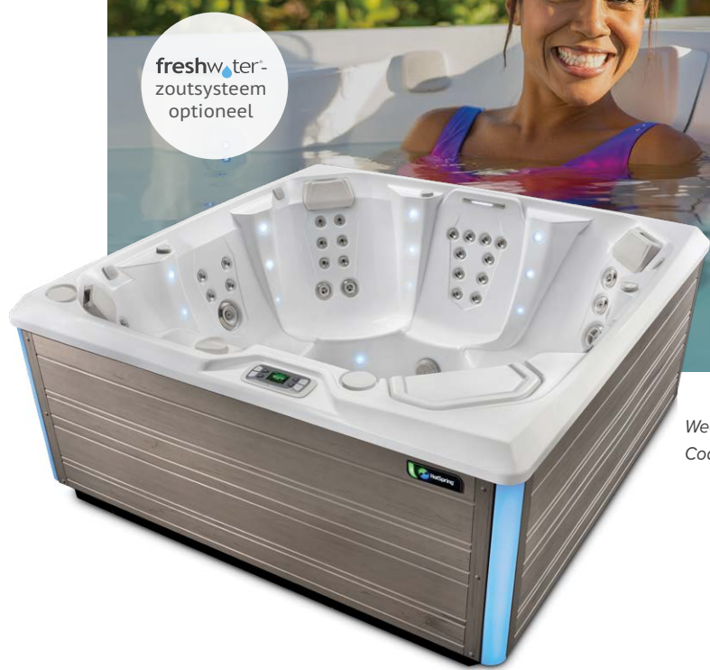
Weergegeven met omkasting in Coastal Grey en kuip in Alpine White

Volwassenen Zitplaatsen Jets Spanning 7 zitplaatsen Geen ligplaats 41 Jets 230 V