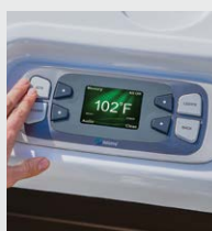
LCD-controlepaneel in kleur