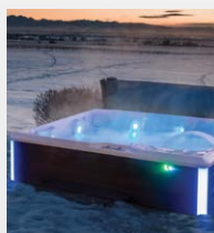
FiberCor®-isolatie met hoge dichtheid