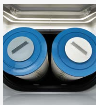
Filtratie met dubbele werking SilentFlo-circulatie