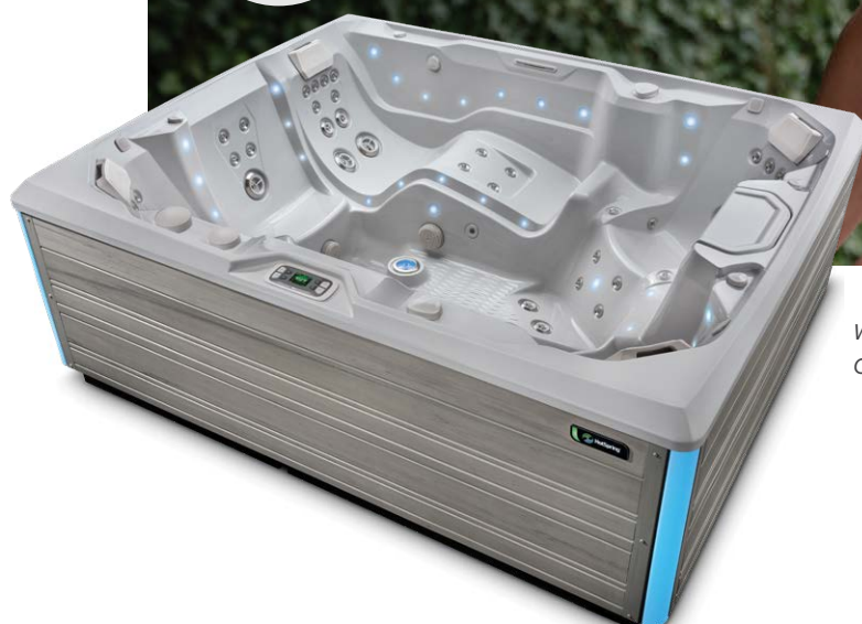
Weergegeven met omkasting in Coastal Grey en kuip in Ice Grey

Volwassenen Zitplaatsen Jets Spanning 7 zitplaatsen Met ligplaats 73 Jets 230 V