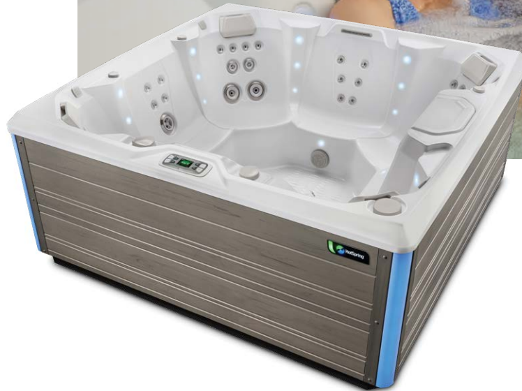
Avec coque Blanc alpin et habillage Gris côtier