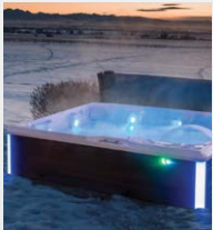
Isolation haute densité FiberCor®