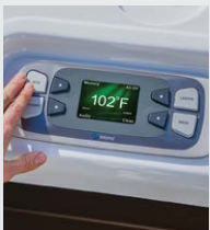
Panneau de commande LCD couleur