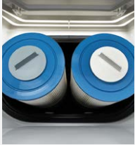
Filtration à action doubleCirculation SilentFlo